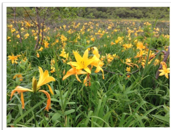
6月に咲くエゾカンゾウ。湿原全体がオレンジ色のお花畑になります。湿原の地下には、2万4000年前からつくられてきたピート（泥炭）と呼ばれる土壌が10mも堆積しています。