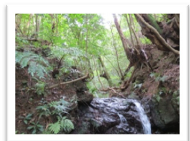
古志集落側からのぞむ南郷山周辺の対象地